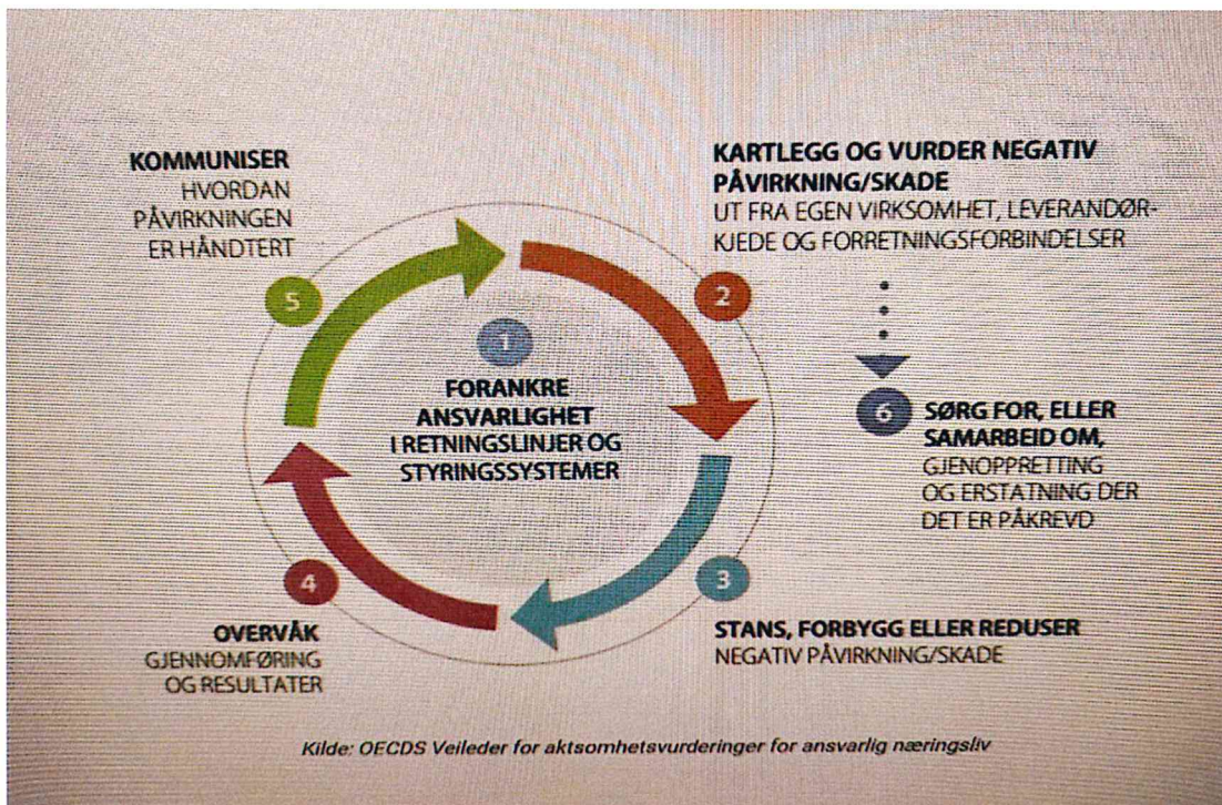
Figur 1.

Vårt arbeid tar vi utgangspunkt i OECDs veileder for aktsomhetsvurderinger for ansvarlig næringsliv for å sikre samsvar med åpenhetsloven. Utgangspunktet for hvordan selskapet ønsker å håndtere prosessen oppsummeres ved figur 1.